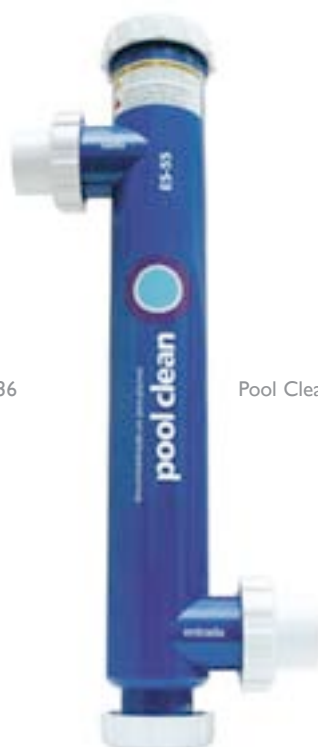
Pool Clean ES-55