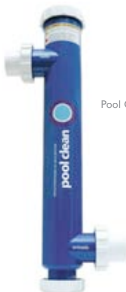
Pool Clean ES-36